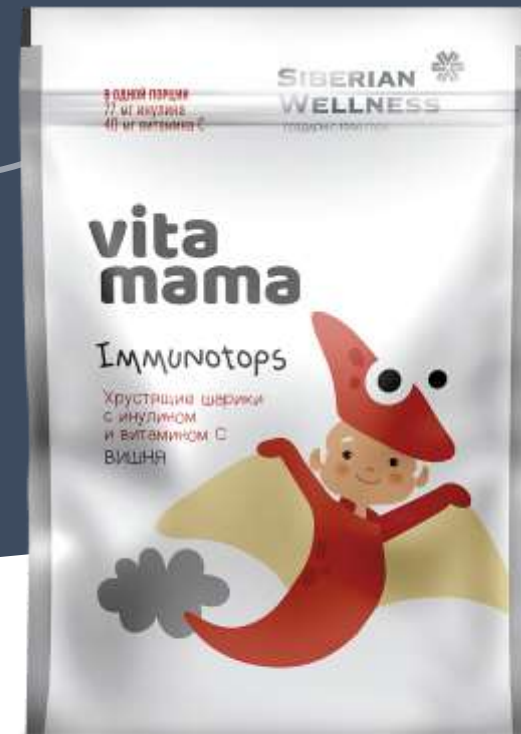
IMMUNOTOPS Хрустящие шарики с инулином (вишня)

Витамин С – 20 мг (100%) 5 экстрактов трав-антисептиков