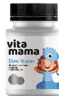
DINO VISION Жевательные таблетки с черникой 0,8 г сахара в 1 порции