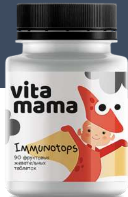
IMMUNOTOPS Жевательные таблетки с клюквой

Витамин А – 100 мкг (20%) Витамин D – 120 МЕ (20%) Витамин С – 50 мг (100%)