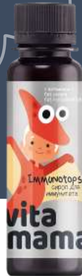
IMMUNOTOPS Сироп с витамином С на вишневом соке

Витамин А – 100 мкг (20%) Витамин D – 120 МЕ (20%) Витамин С – 50 мг (100%)