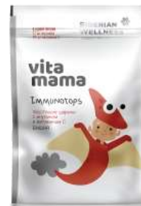
IMMUNOTOPS Хрустящие шарики с инулином и витамином С 0,7 г сахара из сушеных ягод в 1 порции