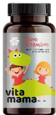
DINO VITAMINO Сироп с витаминами и минералами 0,005 г сахара в 1 порции