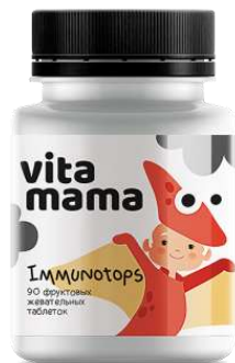
IMMUNOTOPS Жевательные таблетки с клюквой 1,2 г сахара в 1 порции